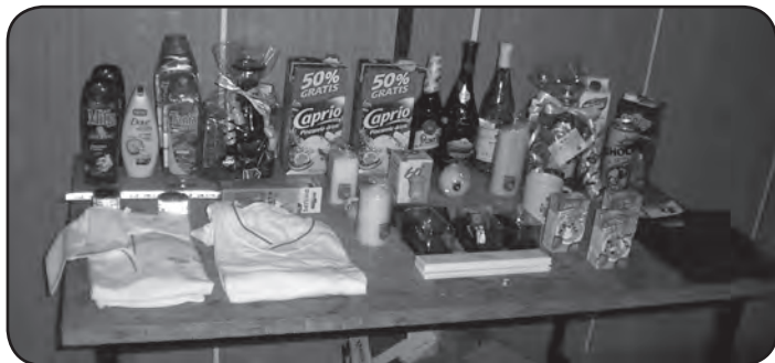
Ceny od sponzorů