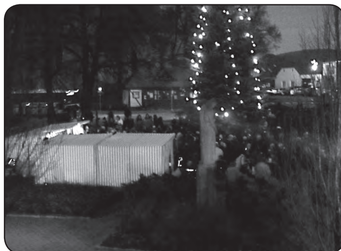
Dětská mikulášská diskotéka neděle 2. 12. 2012 Vertigo