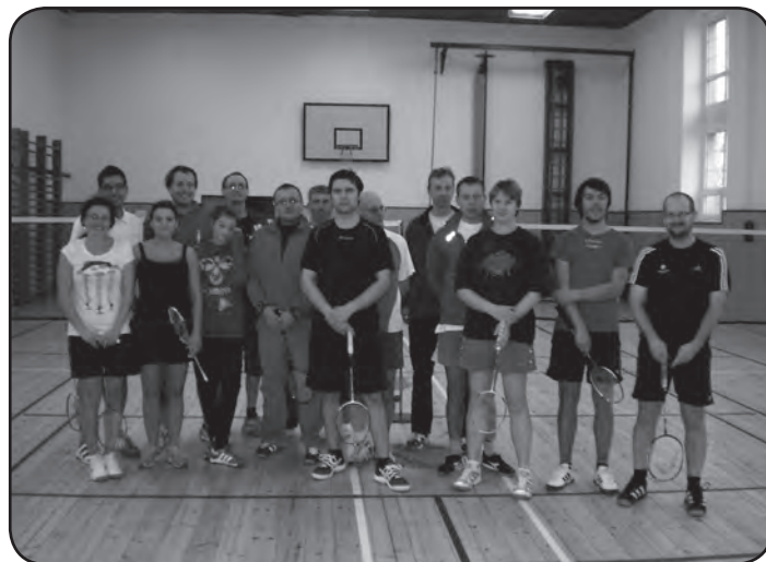
Nástup účastníků před turnajem a vítěz kategorie mužů