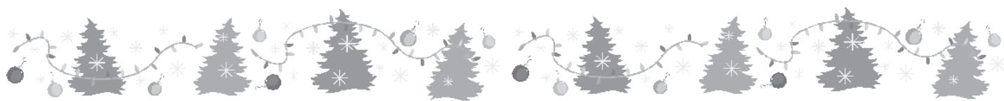
Vítání adventu pátek 30. 11. 2012 náměstí Křemže